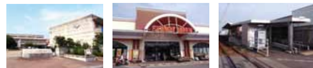
福音小学校 徒歩4分 サンイマ 徒歩2分 伊予鉄 福音寺駅 徒歩9分

【物件概要】●名称…ミサワホームタウン福音寺●所在地…松山市福音寺町284-8●交通…伊予鉄河原線「福音寺」駅徒歩9分(650m)●小学校…福音小学校●中学校…久米中学校●開発総面積…921.75㎡●総区画数…5区画●用途地域…第1種住居地域●建ぺい率…60%●容積率…200%●地目…宅地●水道…上水道●排水…下水道●電気…四国電力株式会社●ガス…プロパンガス●売主…ミサワホーム四国株式会社【モデルハウス分譲概要】●販売区画数…2区画●敷地面積…137.56㎡(41.61坪)・137.52㎡(41.59坪)●延床面積…107.44㎡(32.50坪)・107.23㎡(32.43坪)●販売価格(土地+建物)…4,011万円・3,950万円(消費税8%込み)※諸費用別途必要●建築確認番号…第EPI-18003018号(2号地)、第EPI-17055534号(3号地)●広告有効期限…平成30年6月末日 ※先着順受付につき、ご希望の区画がご商談ならびにご成約の場合がありますので、あらかじめご了承ください。