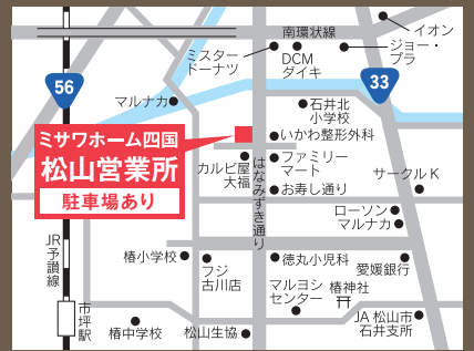
ミサワホーム四国 松山支店の MAP コード / 53227663*13