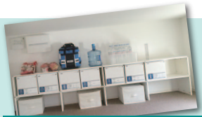
防災備蓄庫としても活用できます！

■1F面積/80.99㎡ (24.49坪) 蔵 6畳 ■延床面積/95.04㎡ (28.74坪)