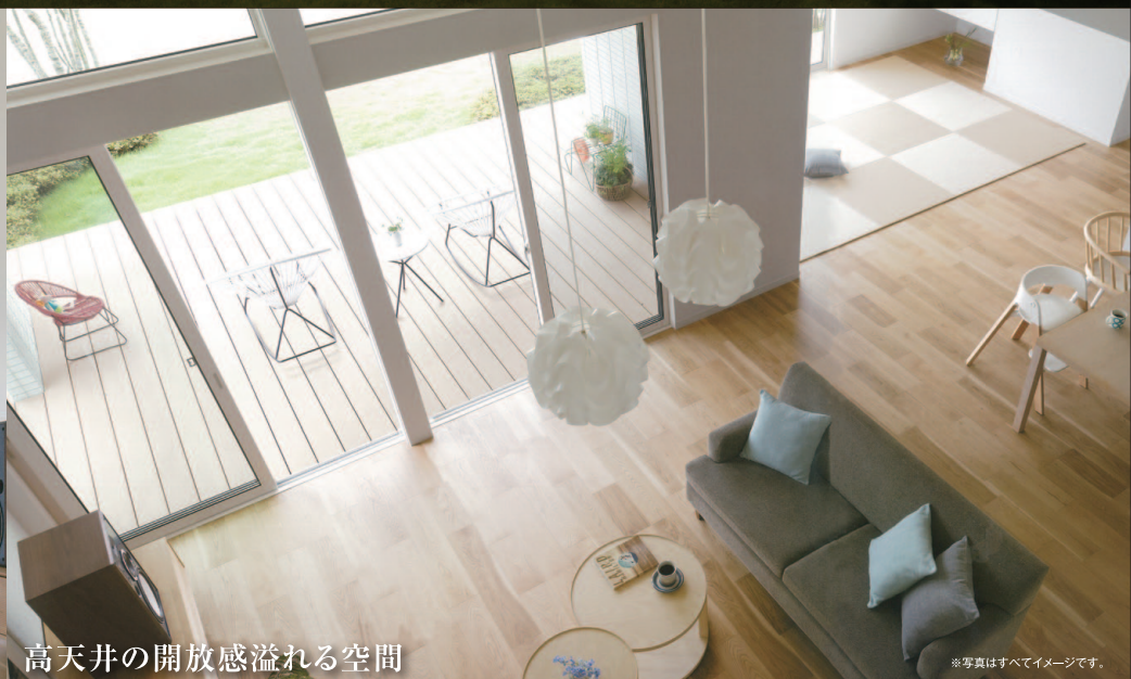
高天井の開放感溢れる空間