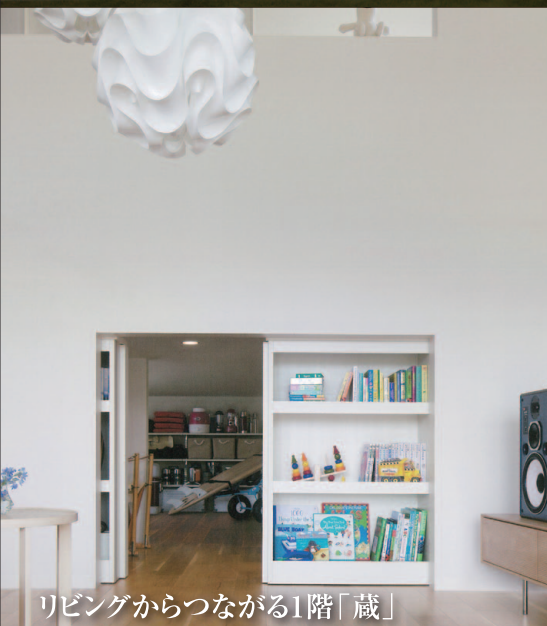
リビングからつながる1階「蔵」

家族がもっとつながる平屋 ⊕ 大収納空間「蔵」 Granlink HIRAYA グランリンク ヒラヤ